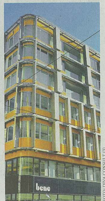
Neutor, ein Blickfang in der City

Die Mischung macht's: Im Erdgeschoß befindet sich ein verglaster Ausstellungsraum, die ersten drei Etagen beherbergen Büros und in den oberen Stockwerken befinden sich Wohnungen mit gehobener Ausstattung.