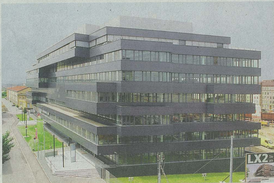
Das Bürogebäude LX2 überzeugte die Jury mit flexiblen Grundrissen