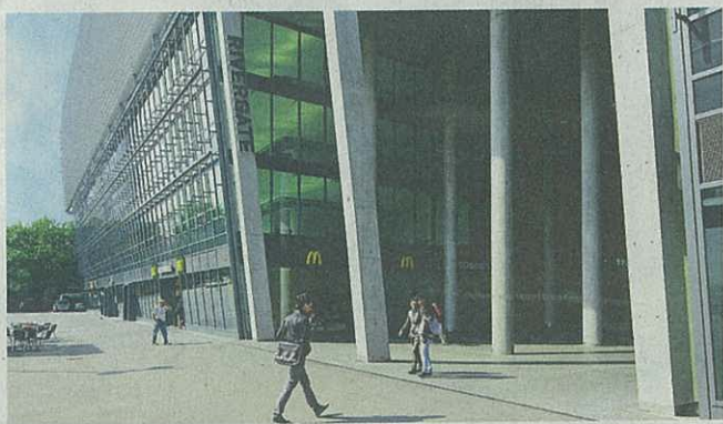
Zwei Jahre Bauzeit: Im Juni wurde das Bürogebäude fertiggestellt